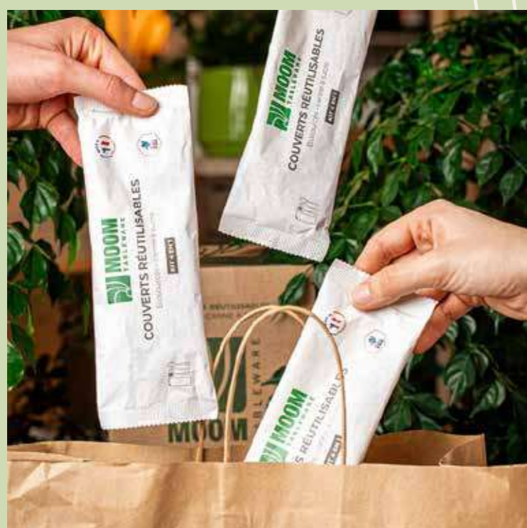
EN FIBRE DE CANNE À SUCRE BIOSOURCÉS