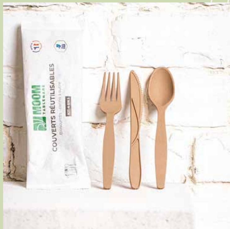
COUVERTS RÉUTILISABLES MIS EN KIT PAR UN ESAT