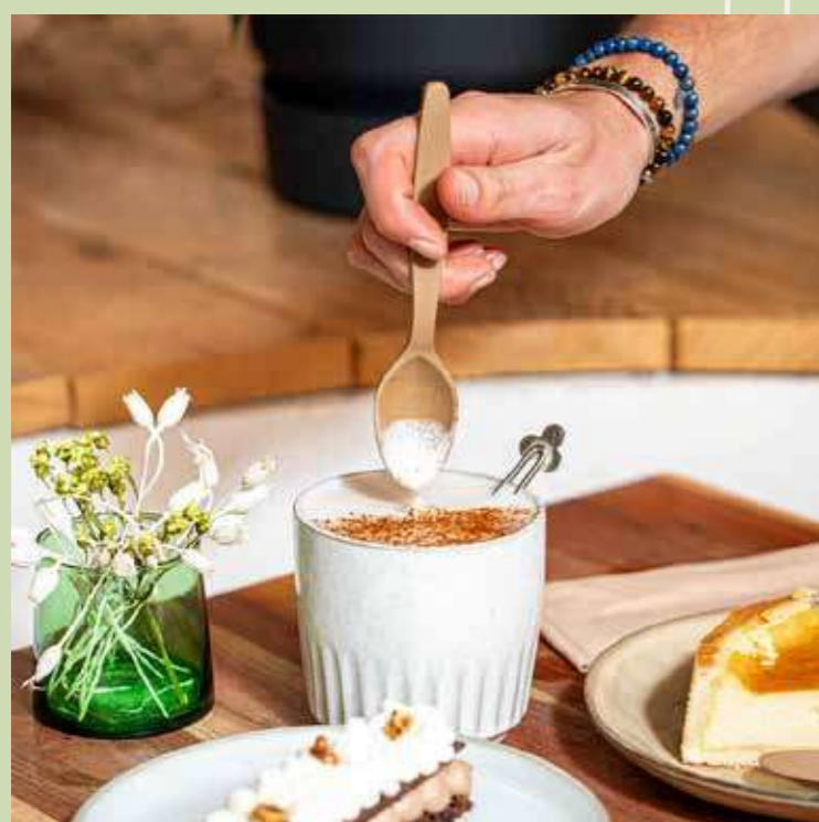
LISSES ET AGRÉABLES EN BOUCHE